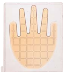
「て・きれいき」 使用后