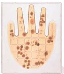
「て・きれいき」 使用前