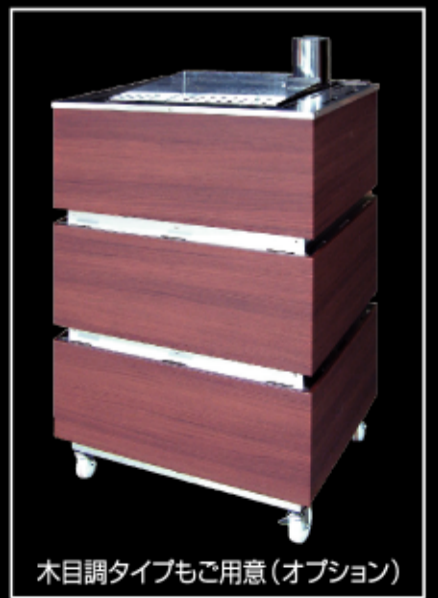
木目調タイプもご用意(オプション)