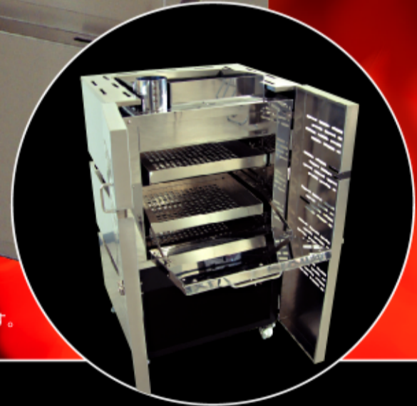
※上記写真はオプション搭載品です。