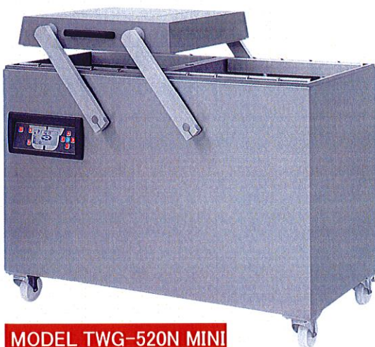
MODEL TWG-520N MINI