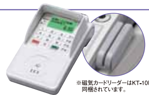
*磁気カードリーダーはKT-10に同梱されています。

*KT-10のご利用は、株式会社CXDネクストの加盟店契約に基づき無償貸し出しいたします。