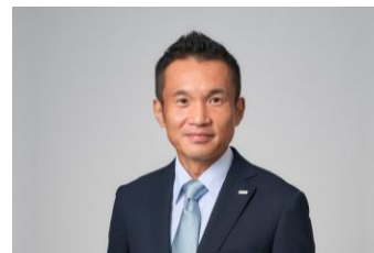
NTTドコモビジネス株式会社 エバンジェリスト

2006年、NTTコミュニケーションズ株式会社(現NTTドコモビジネス株式会社)入社。一貫してセキュリティ領域に携わり多くのお客さまの課題解決を支援しながら、2023年にお客さまの事業継続性を強化する「Cyber Resilience Transformation(CRXソリューション)」を立ち上げ、同社のビジネスを拡大してきた。現在は同社のエバンジェリストの一人として、サイバーセキュリティに関する情報の発信や提言を行いながら、社会・産業の発展やお客さまの課題解決に貢献する活動を担っている。