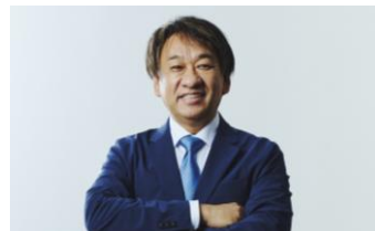
日本マイクロソフト 業務執行役員 エバンジェリスト

マイクロソフトの業務執行役員であり、多くの最新テクノロジーを伝え広めるエバンジェリスト。「エバンジェリスト」とはわかりやすく製品やサービス、技術を紹介する職種。他にコミュニケーションやデモンストレーションといった分野での講演や執筆活動も行い、製造業、金融業、官公庁、教育機関などでのプレゼンテーション講座を幅広く手がける。著書に「エバンジェリストの仕事術」、「プレゼンは「目線」で決まる」などがある。