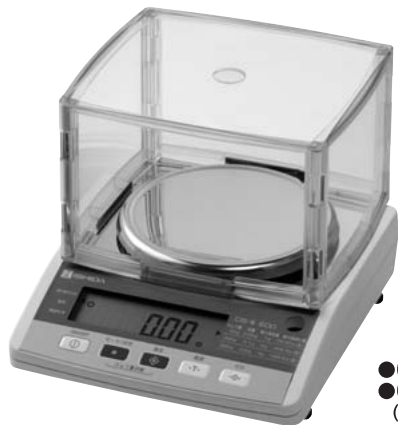
●CB-III300 ●CB-III600 (オプション:風防付)