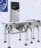
ウェイトチェッカー