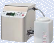
電解次亜水生成機