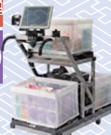
マルチピッキングカート