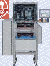
自動計量包装値付機