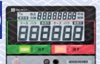
仕分用無線表示器