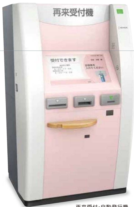
再来受付・自動発行機